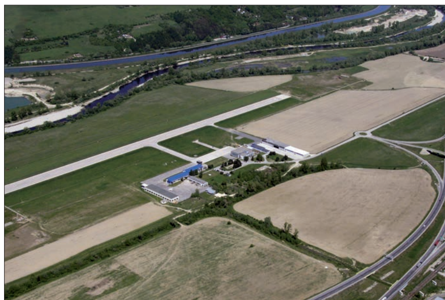
Letecký pohľad na letisko v Dolnom Hričove. V titule Piper PA-28RT-201T Arrow Žilinskej univerzity

prehľadu a pochopeniu prepojení medzi oblasťami letectva bolo pre mňa ľahšie tieto detaily spracovať. Škola vás nemôže dokonale pripraviť na nástrahy profesijného života, ale znalosti vám pomôžu adaptovať sa a začať profilovať svoju kariéru. Najťažšie bolo prísť na to, čomu by som sa chcel po škole venovať. Po práci v konzultačnej spoločnosti som nakoniec „pristál“ v oblasti Safety pri poskytovaní leteckých navigačných služieb. Základnú predstavu o bezpečnosti leteckej prevádzky a Systému manažmentu bezpečnosti som mal, no prekvapila ma šírka tejto oblasti. Aj po niekoľkých rokoch praxe sa stále učím nové veci. Teší ma to, učenie je jedna z činností, na ktoré ma univerzita pripravila. Zároveň som rád, že ma priviedla bližšie k letectvu a svojím spôsobom mi dala krídla. ■